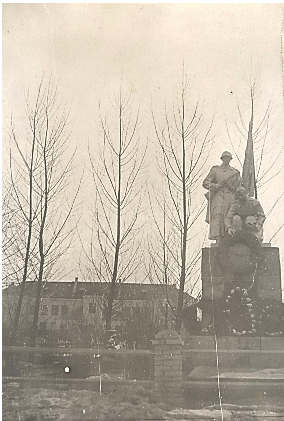
Памятник на братской могиле № 4043, установленный в 1956 г.