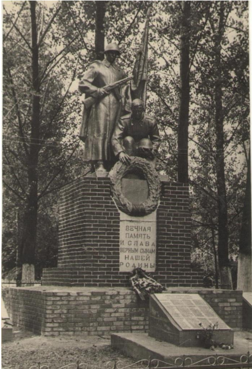
Братская могила № 4043 в г.п. Бешенковичи. Фотография 1975 г.