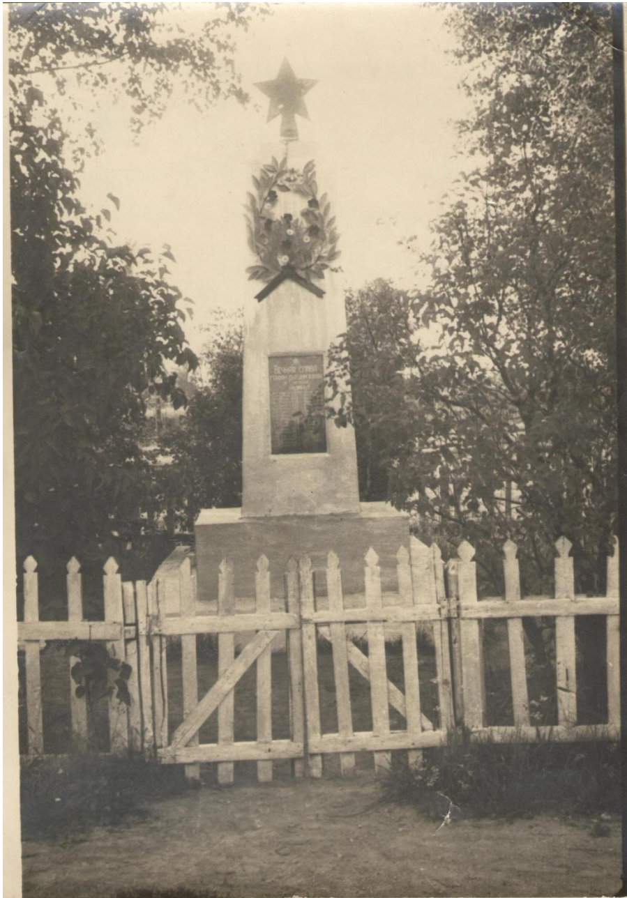
Первоначальный памятник на братской могиле № 4043. Он был заменен на скульптурную композицию в 1956 г.