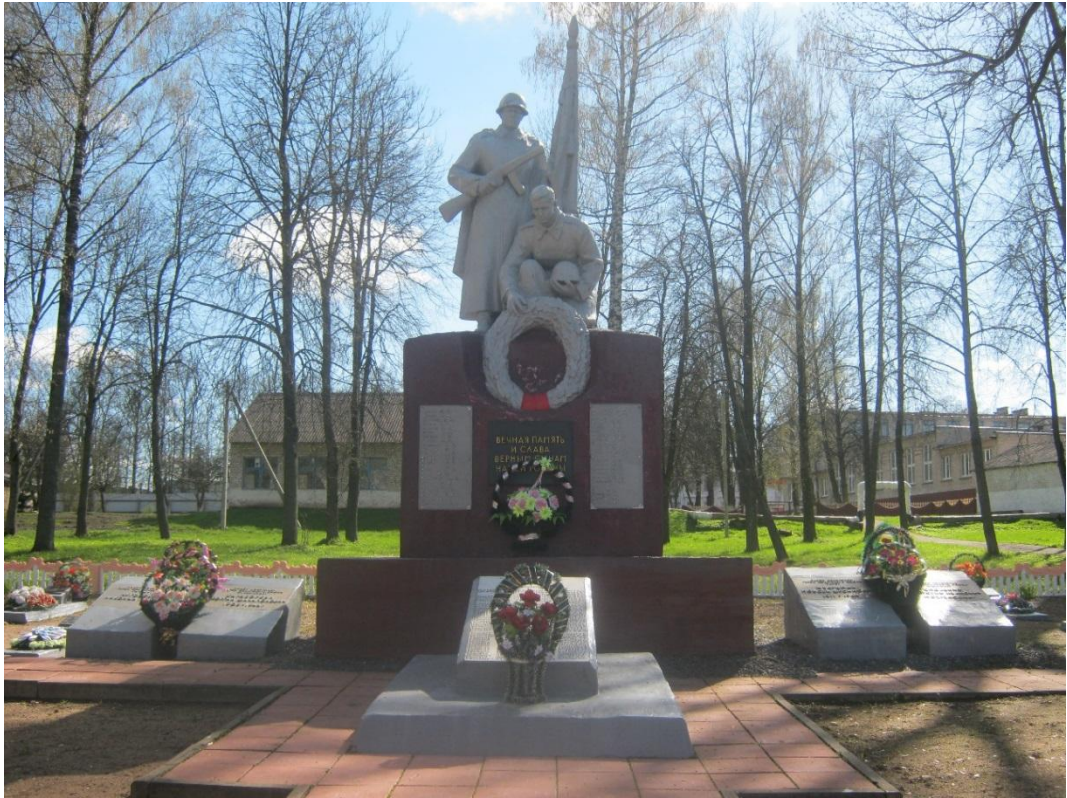
Братская могила № 4043. Фотография 2016 г.