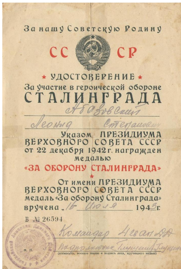
Удостоверение за участие в героической обороне Сталинграда.